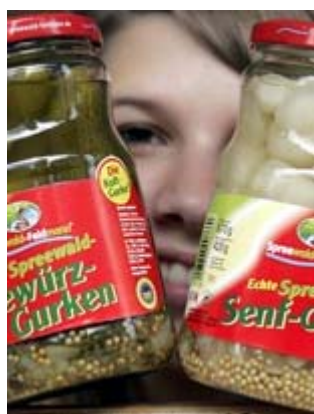
Im Osten ein Renner: Spreewaldgurken.